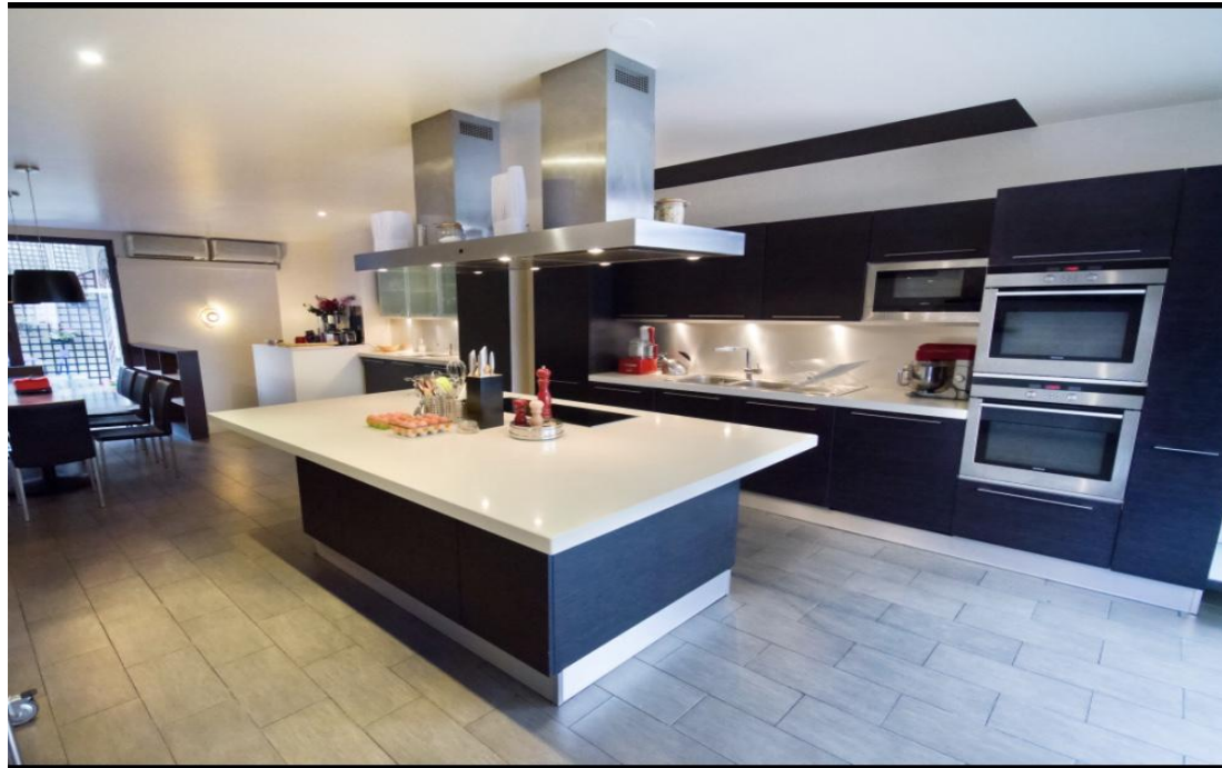
Cours de cuisine “Cocktail Party”